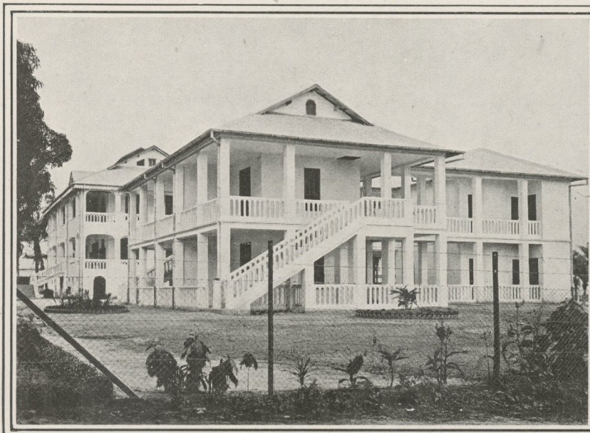
AGENCE DE LA BANQUE DU CONGO BELGE A KINSHASA.

BUREAUX A LONDRES : 9, Bishopsgate, E. C. 2.