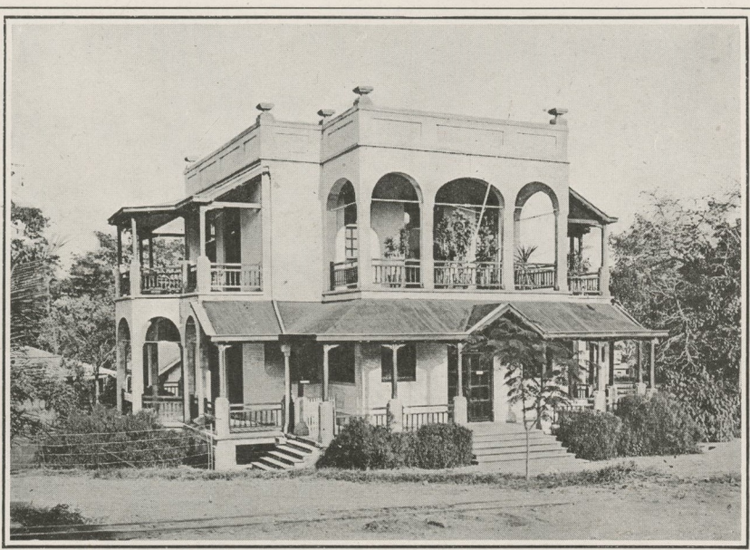
AGENCE DE LA BANQUE DU CONGO BELGE A BOMA

AGENCES EN AFRIQUE : Bandundu, Basankusu, Basoko, Boma, Buta, Coquilhatville, Dar-es-Salaam, Elisabethville, Inongo, Kabinda, Kilo, Kinshasa, Kasongo, Kigoma, Kongolo, Libenge, Lisala, Luebo, Lusambo, Matadi, Niangara, Ponthierville, Rutshuru, Sandoa, Stanleyville.